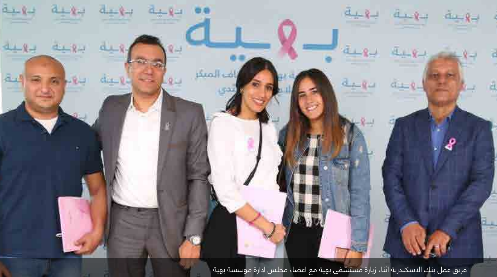
فريق عمل بنك الإسكندرية أثناء زيارة مستشفى بهية مع أعضاء مجلس إدارة مؤسسة بهية

وتبرعات العاملين بالبنك الذين قاموا بزيارة مستعمرة الجذام، لقد تمكنا من المساهمة في تغيير الحياة اليومية لمرضى مستعمرة الجذام عن طريق توفير عدد من الإعانات مثل: عدد 0 كراسي متحركة، و عدد 0٦ عكازاً وعدد ٣٨ مرتبة.