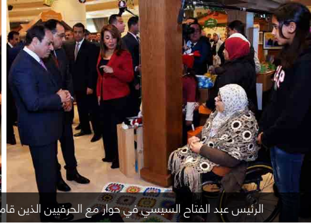
الرئيس عبد الفتاح السيسي في حوار مع الحرفيين الذين قاموا باعداد المنتجات المعروضة في قصتنا في حرفتنا

سويا بالتعاون مع مؤسسة ساويرس للتنمية الاجتماعية اطلق بنك الإسكندرية مشروع « قصتنا في حرفتنا» و الذي يسعى الى ادماج وتمكين الأشخاص ذوي الاحتياجات الخاصة في قطاع الحرف اليدوية. لقد تم اطلاق المشروع بديسمبر ٢٠١٨ خلال احتفالية ذوي الإعاقة تحت رعاية وبحضور السيد رئيس الجمهورية والتي كانت بمناسبة ختام عام الأشخاص ذوي الإعاقة. وعلى هامش الاحتفالية تم عقد بازار قصتنا في حرفتنا والذي احتوى على منتجات يدوية من صنع الأشخاص متحدي الإعاقة. واستكمالاً لنجاح مبادرة «إبداع من مصر» الفائق لقد أضحت الشمولية الهدف الراهن للمبادرة، حيث سوف يوفر المشروع لهؤلاء الفنانين قنوات متعددة وخبرات على مستوى أكثر من حرفة ومحافظة.