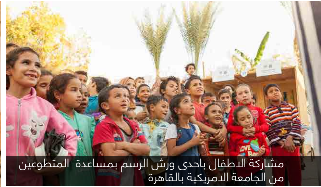
مشاركة الاطفال باحدى ورش الرسم بمساعدة المتطوعين من الجامعة الامريكية بالقاهرة