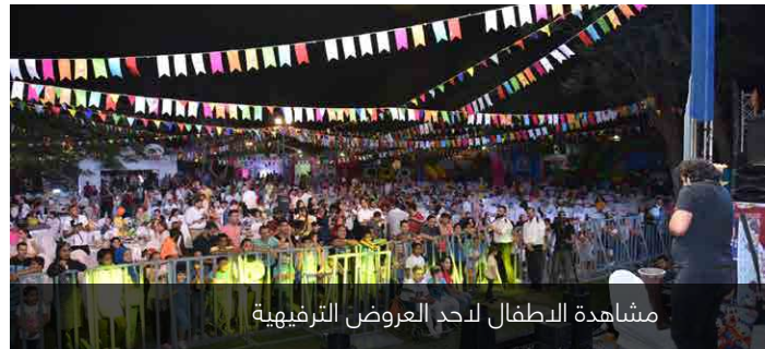
مشاهدة الاطفال لحد العروض الترفيهية

عقد بنك الإسكندرية ومؤسسة ساويرس للتنمية الاجتماعية هذا العام وللمرة الثانية على التوالي الإفطار السنوي المخصص للأطفال بلا مأوى، وذلك بالتعاون مع سامو-سوسيال الدولية-مصر. لقد تمت هذه الاحتفالية المليئة بالمرح والأنشطة الترفيهية بحديقة الحرية بالزمالك تحت رعاية وزارة التضامن الاجتماعي. وعلى هامش الاحتفالية، وقع بنك الإسكندرية مع مؤسسة ساويرس بروتوكول تعاون بقيمة 0٠ مليون جنيه مصري، والذي سوف يدمج عدد من منظمات المجتمع المدني لتشارك في تنفيذ الأنشطة المتفق عليها مثل: مؤسسة أبناء الغد: «بناتي»، المؤسسة المصرية «أنا المصري» وساموسوسيال مصر. الهدف المطلق لهذه المبادرة هو تزويد الأطفال بالرعاية اللائقة والامنة للرعاية في البيوت المقدمة للرعاية وذلك يتضمن: التعليم، التغذية، العلاج، التعليم المهني لتسهيل فرص الحصول على الوظائف المناسبة في المستقبل.