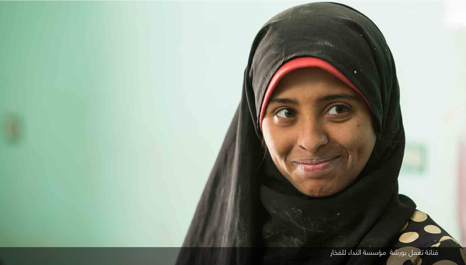
فنانة تعمل بورشة مؤسسة النداء للفخار

لقد تم اعتماد الاستراتيجية الجديدة لمكتب المسؤولية الاجتماعية والتنمية المستدامة من قبل مجلس الادارة في ٣١ يوليو ٢٠١٨، وترسخ الاستراتيجية من الدور الريادي لبنك الإسكندرية كشريك للمجتمع من منظور متكامل للقيمة المشتركة، يقوم على مبادرات مستدامة لتنمية المجتمع، التمويل الاحتوائي، استثمارات مسؤولة اجتماعياً، برامج توعية مالية على نطاق واسع واستدامة بيئية. ومع بداية عام ٢٠١٨، بدأ المكتب في اتخاذ خطوات إضافية نحو تصميم وتنفيذ مشاريع اجتماعية مولدة لقيمة اقتصادية للمؤسسة واجتماعية للمجتمع على حد سواء، وذلك استجابة للاحتياجات الاجتماعية، الاقتصادية، والبيئية للدولة. وتتمحور الاستراتيجية حول ثلاثة ابعاد وهي: