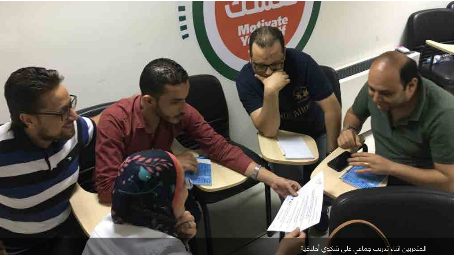
المتدربين اثناء تدريب جماعي على شكوي أخلاقية

وتركزت اهداف التدريب حول: ١. زيادة التوعية بخصوص المسائل الأخلاقية عند التعامل مع العملاء ٢. تحسين جودة خدمة العملاء عند التعامل مع المسائل الاخلاقية ٣. اشراك جميع الأطراف المعنيين بالتعامل مع المسائل ذات العلاقة بالمبادئ والقيم للاستفادة من تبادل الآراء.