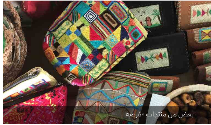
بعض من منتجات «فرصة»