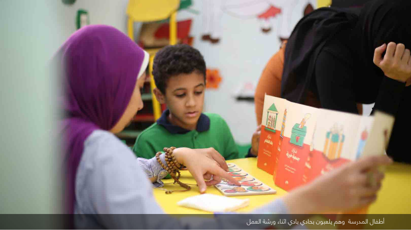
أطفال المدرسة وهم يلعبون بحادي بادي أثناء ورشة العمل

المالية للأطفال الذين تتراوح أعمارهم بين ٨-١٠ سنوات. ولهذا الغرض، تم تصميم لعبة خصيصاً من قبل مكتب المسؤولية الاجتماعية والتنمية المستدامة ببنك الاسكندرية «حادي بادي» لتعليم الأطفال المصريين مهارات متعلقة بكيفية الانفاق والادخار للحصول على الأشياء التي يحتاجونها بالإضافة الى التبرع.