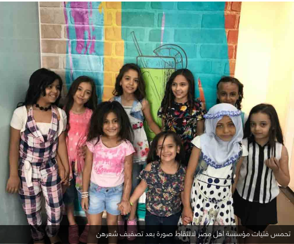
تحمس فتيات مؤسسة اهل مصر لالتقاط صورة بعد تصفيف شعرهن