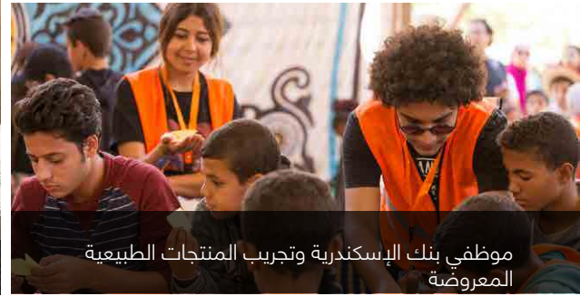
موظفي بنك الإسكندرية وتجريب المنتجات الطبيعية المعروضة

للعام الرابع على التوالي، تقوم مبادرة ابداع من مصر بتنظيم المهرجان السنوي لقرية تونس بالتعاون مع جمعية خزافي قرية تونس تحت رعاية محافظة الفيوم. هذا العام تم إضافة ثلاث ورش عمل بحيث يصل اجمالي الورش الى 10 ورشة تحت مظلة ابداع من مصر. لقد احتوى المهرجان على أنشطة عديدة وحيوية مثل: عروض موسيقية، سينما. ورش عمل علاوة على صناعات يدوية من أكثر من محافظة مما ساهم في جذب الزوار الأجانب والمصريين، حيث وصل اجمالي الزوار الى حوالي ٣٠٠٠ شخص من مختلف المحافظات هذا بالإضافة الى أكثر من ٢٠٠ موظف من البنك الذين حضروا برفقة اسرهم من القاهرة، الاسماعلية، السويس والإسكندرية. كما اشتمل المهرجان على اعمال فنية فريدة تمثل نتاج مجهود عام بأكمله من الفخار والعديد من الصناعات اليدوية الأخرى بما في ذلك نحت الخشب والجرانيت والسجاد اليدوي والنحاس المطروق.