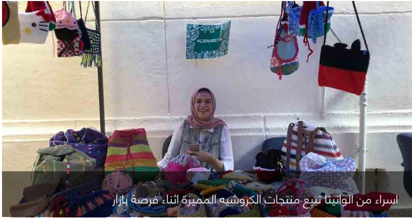
اسراء من الوايتنا تباع منتجات الكروشيه المميزة اثناء فرصة بازار