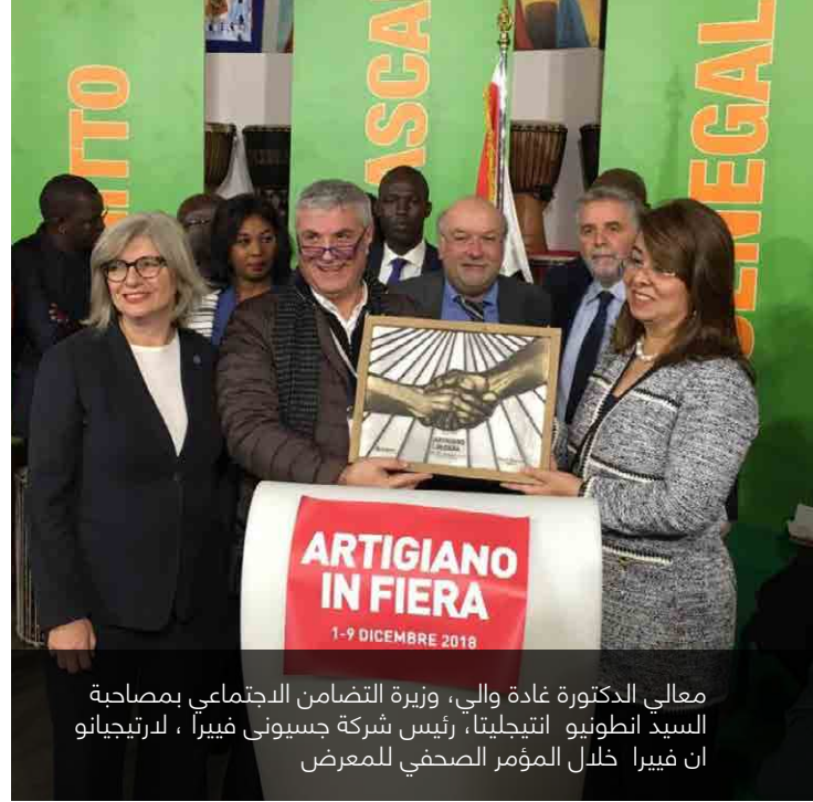
معالي الدكتورة غادة والي، وزيرة التضامن الاجتماعي بمصاحبة السيد انطونيو انتيجليتا، رئيس شركة جسيوني فييرا، لارتيجيانو ان فييرا خلال المؤتمر الصحفي للمعرض

بالتعاون مع وزارة التضامن الاجتماعي والغرفة التجارية الإيطالية بمصر وتحت رعاية «مبادرة» ابداع من مصر»، تم اختيار عدد ٢٤ فنان مصري للمشاركة بمعرض ارتيجيانو ان فييرا، والذي يعتبر من ضمن اكبر معارض الحرف اليدوية بأوروبا منذ ١٩٩٦. ينعقد المهرجان خلال الفترة من ١ الى ٩ ديسمبر على مساحة ١٢٠ متر مربع مخصصة لعدد ٢٤ فنان متضمنين ٥ شركاء لمبادرة ابداع من مصر الذي سنحت لهم الفرصة ان يعرضوا منتجاتهم لزوار من مختلف انحاء العالم. يعتبر المعرض فرصة متميزة لشراء، ومشاهدة منتجات يدوية من مختلف انحاء العالم ذات جودة عالية في مكان واحد.