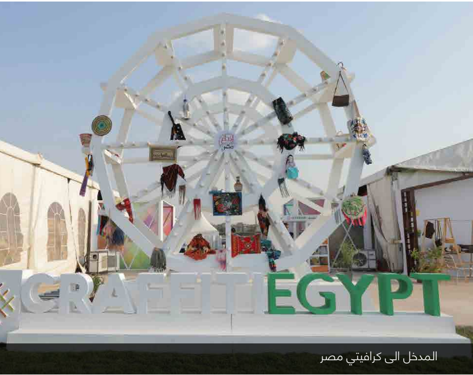
المدخل الى كرافيتي مصر