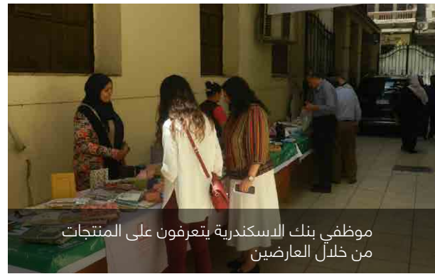
موظفي بنك الإسكندرية يتعرفون على المنتجات من خلال العارضين

الموظفين بالقضايا البيئية الملحة بعالمنا المعاصر، قام مكتب المسؤولية الاجتماعية والتنمية المستدامة بالاحتفال باليوم العالمي للبيئة يوم السادس من يونيو عام ٢٠١٨ بتنظيم بازار بمقره الرئيسي مخصصا فقط للمنتجات المعاد تدويرها. لقد سمح هذا اليوم للموظفين التعرف على أهمية إعادة تدوير المخلفات حفاظا على البيئة والمجتمع ككل. بالإضافة الى ذلك، فقد تم اتاحة الفرصة للموظفين للتعرف على اهمية تقليل الاعتماد على منتجات البلاستيك ذات الاستخدام الفردي. وكان موضوع هذا اليوم هو «محاربة تلوث البلاستيك».