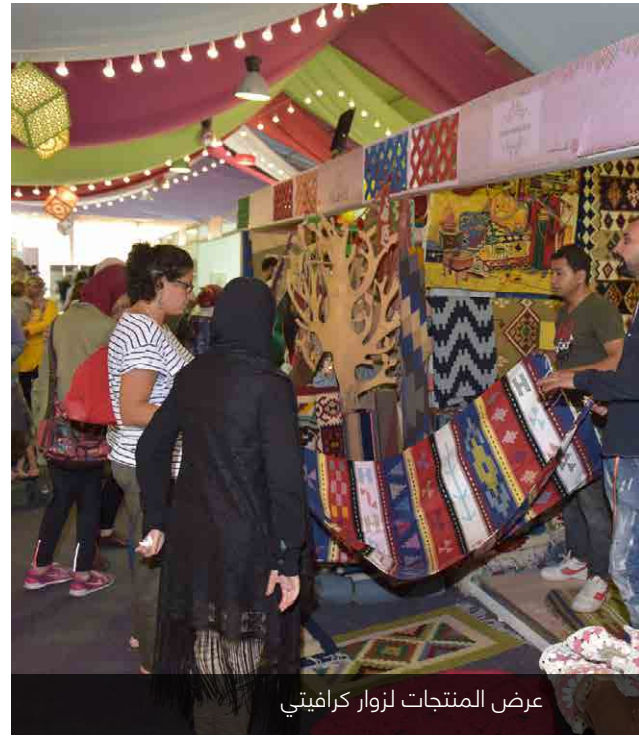
عرض المنتجات لزوار كرافيتي

في اطار مساعينا المستمرة لتمكين الحرفيين المصريين، شارك بنك الإسكندرية كشريك استراتيجي بمعرض كرافيتي للحرف اليدوية في اول عام لانطلاقه. بتنظيم من المجلس التصديري للصناعات اليدوية وغرفة صناعة الحرف اليدوية تحت رعاية وزارة التضامن الاجتماعي بمشاركة عدد ٢٥٠ عارض محلي من جميع انحاء مصر متمتعين بفرص مباشرة للبيع. وكما هو معتاد، لقد خصص بنك الإسكندرية مساحة كبيرة لصالح شركائه من «ابداع من مصر» مع اكثر من ٧٠٪ مخصصة للمبيعات المباشرة.