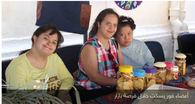
أعضاء فور بسكت خلال فرصة بازار