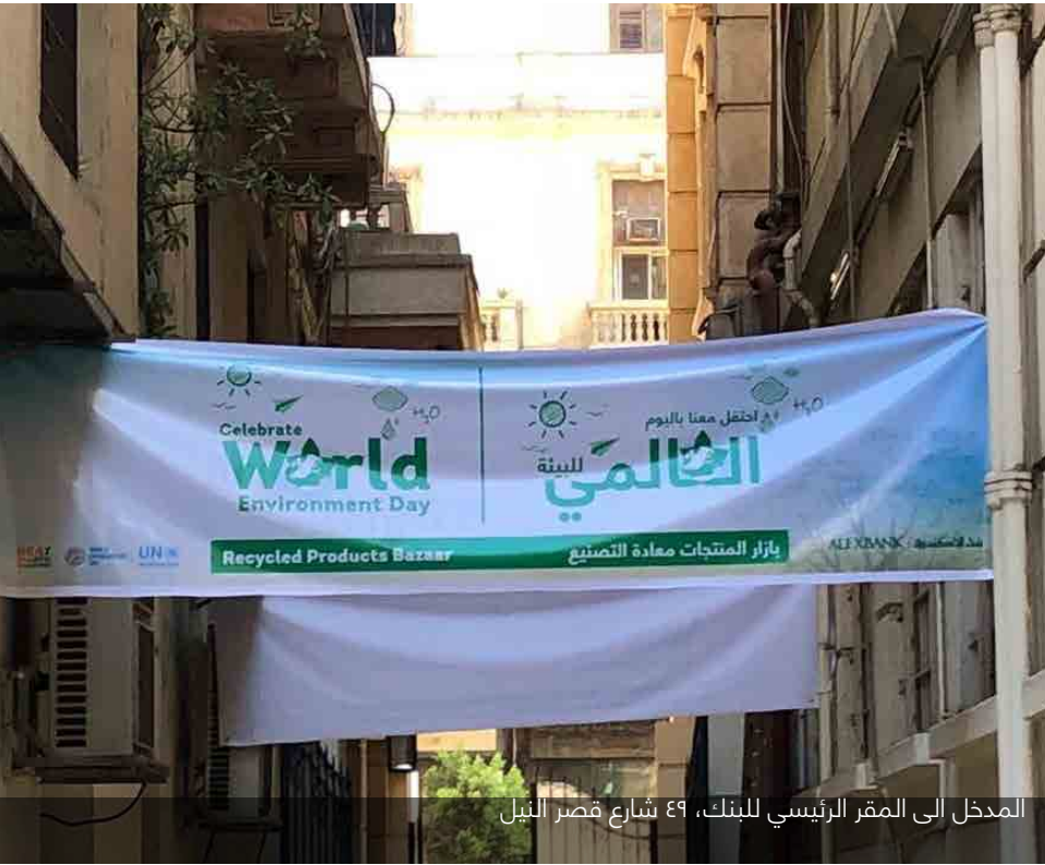
المدخل الى المقر الرئيسي للبنك، ٤٩ شارع قصر النيل