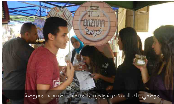
موظفي بنك الإسكندرية وتجريب المنتجات الطبيعية المعروضة

بذلك مثل: أدوات مكتبية وتعليمية، مستلزمات مكتبية. وفيما يتعلق بنسخة أكتوبر عام ٢٠١٨ من البازار فكانت مخصصة لتعكس التضامن مع مكافحة سرطان الثدي والتوعية بالمرض. بالإضافة الى ذلك، لقد تبرع جميع العارضين بنسبة ٥% من اجمالي مبيعاتهم لمؤسسة بهية للاكتشاف المبكر وعلاج سرطان الثدي. وفي نوفمبر عام ٢٠١٨ واتساقا مع الأسبوع العالمي لريادة الاعمال، فقد حرصنا على ابراز رواد اعمال «ابداع من مصر» الذين يساهمون في تعزيز الاقتصاد الإبداعي في مصر. والاسبوع العالمي لريادة الاعمال هو احتفاء بالمبدعين الذين يؤسسون شركات ناشئة قائمة على الأفكار المبتكرة. اما نسخة ديسمبر عام ٢٠١٨ فكانت مخصصة للكريسماس.