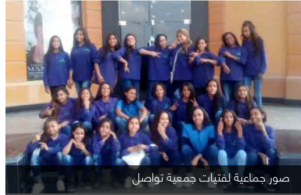
صور جماعية لفتيات جمعية تواصل