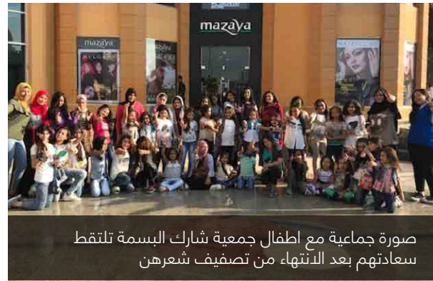
صورة جماعية مع اطفال جمعية شارك البسمة تلتقط سعادتهم بعد الانتهاء من تصفيف شعرهن