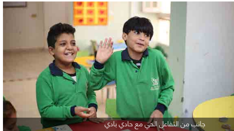
جانب من التفاعل الحي مع حادي بادي