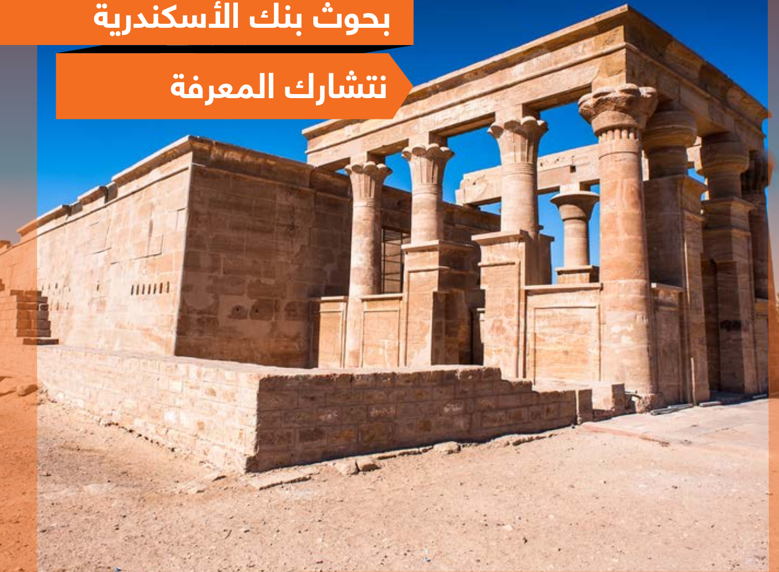
معبد هابيس، الوادي الجديد، مصر