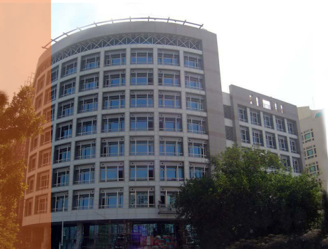
بنك التصدير والاستيراد الافريقي، القاهرة، مصر